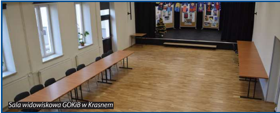
Sala widowiskowa GOKiB w Krasnem

W ostatnich miesiącach zakończone zostały kolejne strategiczne inwestycje zrealizowane przez Gminę Krasne dzięki pozyskanym środkom zewnętrznym. Po ponad półrocznym okresie nieobecności, do swojej powiększonej siedziby wraca Gminny Ośrodek Kultury i Biblioteka w Krasnem. Pierwsze piętro dotychczasowego budynku GOKiB oraz budynek dawnej apteki w Krasnem został wyremontowany pod potrzeby Dziennego Domu Pomocy dla Seniorów. W listopadzie br. zakończona została budowa pierwszego Publicznego Żłobka w Krasnem. Budynek czeka w chwili obecnej jedynie na dostawę wyposażenia, rozpoczęcie jego funkcjonowania planowane jest w styczniu 2019 r.