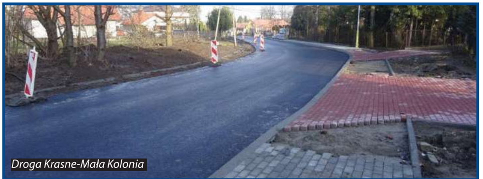
Droga Krasne-Mała Kolonia

o długości 770 m, która w ostatnich latach została dostosowana do parametrów, jakim powinny odpowiadać gminne drogi publiczne. W ramach istniejącego pasa drogowego wykonana została droga jednojezdniowa z pobocznymi obustronnymi, wyposażona w odwodnienie i oświetlenie LED. Wartość zrealizowanej inwestycji to 1