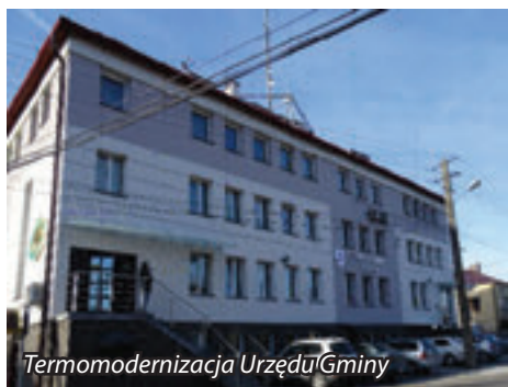
Termomodernizacja Urzędu Gminy