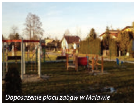
Doposażenie placu zabaw w Malawie

W roku bieżącym ze środków funduszu sołeckiego doposażony został plac zabaw w miejscowości Malawa, plac zabaw koło apteki w Krasnem, wykonany etap parkingu przy Zespole Szkół w Palikówce oraz prace na stadionie sportowym w Strażowie.