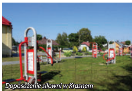
Doposażenie siłowni w Krasnem