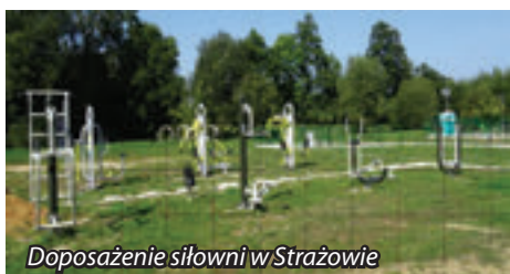
Doposażenie siłowni w Strażowie

W roku bieżącym ze środków funduszu sołeckiego doposażony został plac zabaw w miejscowości Malawa, plac zabaw koło apteki w Krasnem, wykonany etap parkingu przy Zespole Szkół w Palikówce oraz prace na stadionie sportowym w Strażowie.