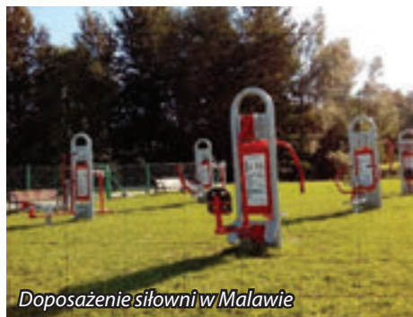
Doposażenie siłowni w Malawie

Zgodnie z ubiegłorocznymi zapowiedziami w miesiącu czerwcu 2017 roku wszystkie siłownie zewnętrzne na terenie naszej gminy zostały rozbudowane o kolejne urządzenia.