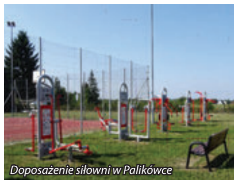
Doposażenie siłowni w Palikówce