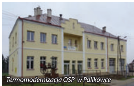
Termomodernizacja OSP w Palikówce

Zakończone zostały prace związane z termomodernizacją obiektów użyteczności publicznej, realizowane przy 85 % wsparciu finansowym z RPO WP 2014-2020, prowadzone w Zespole Szkół w Malawie, budynku OSP w Palikówce oraz budynku Urzędu Gminy Krasne.