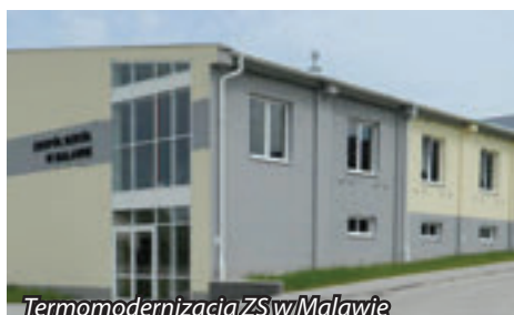
Termomodernizacja ZS w Malawie

Na koniec grudnia planowane jest zakończenie najbardziej oczekiwanej przez mieszkańców Krasnego inwestycji, budowy 8 oddziałowego przedszkola w miejscowości Krasne o powierzchni użytkowej 1575 m 2 . Rozpoczęcie funkcjonowania przedszkola planowane jest w pierwszym kwartale 2018 roku.