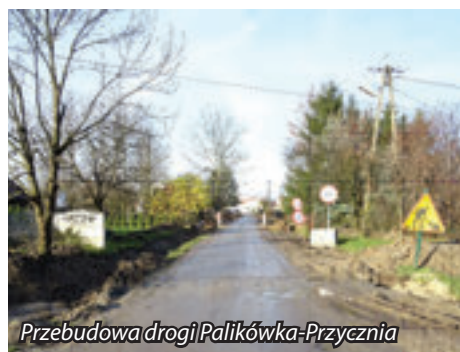
Przebudowa drogi Palikówka-Przycznia

Ruszyły również pierwsze inwestycje, które realizowane będą przy udziale środków RPO WP dedykowanych dla ROF. Podpisane zostały umowy w ramach których do końca roku 2018 zostanie zrealizowana przebudowa drogi gminnej Nr 108554R Przycznia w Palikówce, rozbudowa drogi Mała Kolonia Nr 108553 R oraz budowa 7 zatok autobusowych przy drogach powiatowych na terenie gminy Krasne. Przedsięwzięcia wykonane będą w ramach projektu Rozwój gospodarki niskoemisyjnej oraz poprawa mobilności mieszkańców poprzez usprawnienie zrównoważonego transportu publicznego na terenie ROF, przy dofinansowaniu 85% kosztów kwalifikowanych.