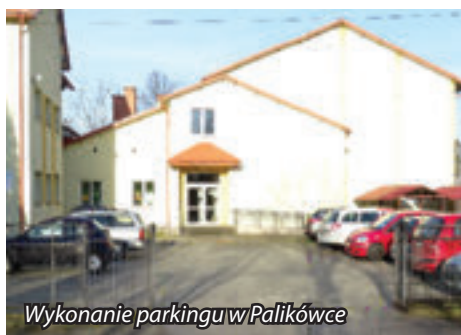
Wykonanie parkingu w Palikówce

Ruszyły również pierwsze inwestycje, które realizowane będą przy udziale środków RPO WP dedykowanych dla ROF. Podpisane zostały umowy w ramach których do końca roku 2018 zostanie zrealizowana przebudowa drogi gminnej Nr 108554R Przycznia w Palikówce, rozbudowa drogi Mała Kolonia Nr 108553 R oraz budowa 7 zatok autobusowych przy drogach powiatowych na terenie gminy Krasne. Przedsięwzięcia wykonane będą w ramach projektu Rozwój gospodarki niskoemisyjnej oraz poprawa mobilności mieszkańców poprzez usprawnienie zrównoważonego transportu publicznego na terenie ROF, przy dofinansowaniu 85% kosztów kwalifikowanych.