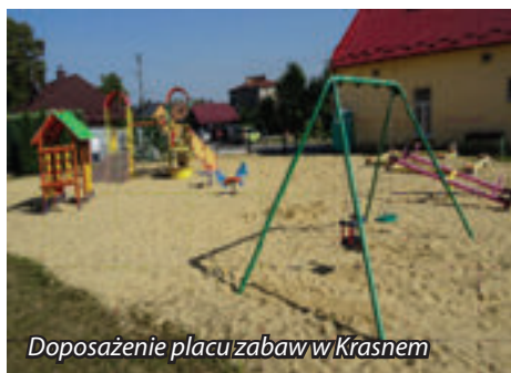
Doposażenie placu zabaw w Krasnem