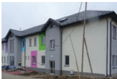
Budowa Przedszkola w Krasnem

Na koniec grudnia planowane jest zakończenie najbardziej oczekiwanej przez mieszkańców Krasnego inwestycji, budowy 8 oddziałowego przedszkola w miejscowości Krasne o powierzchni użytkowej 1575 m 2 . Rozpoczęcie funkcjonowania przedszkola planowane jest w pierwszym kwartale 2018 roku.