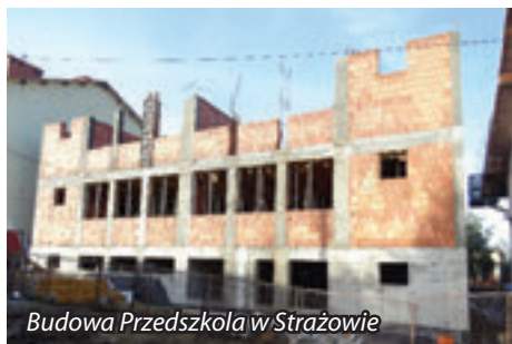
Budowa Przedszkola w Strażowie

Do końca roku zostanie zakończony stan surowy rozbudowy budynku ZS w Strażowie pod potrzeby przedszkola 4 oddziałowego.