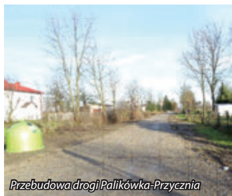
Przebudowa drogi Palikówka-Przycznia

W ramach Programu ochrony gruntów rolnych w br. zmodernizowana została droga wewnętrzna do stadionu sportowego w Palikówce. Nowa konstrukcja nawierzchni jezdni, pozwoli na wykonanie warstwy wiążącej i ścieralnej z betonu asfaltowego w kolejnym etapie inwestycji.