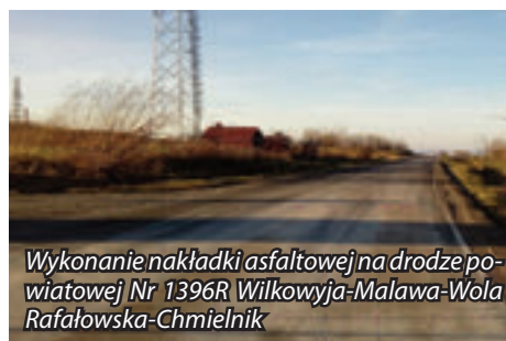
Wykonanie nakładki asfaltowej na drodze powiatowej Nr 1396R Wilkowyja-Malawa-Wola Rafałowska-Chmielnik

W Gminie Krasne prowadzone były również roboty na drogach powiatowych administrowanych przez Zarząd Dróg Powiatowych.